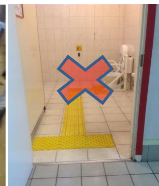
Фото 1, фото 2 – маршрут движения инвалида по зрению, выполненный в виде наклеенных на поверхность тактильных ПВХ плиток с различным рисунком (риффы в шахматном порядке, диагональные риффы, параллельные риффы).

Фото 3 – маршрут движения инвалида по зрению в санузле, выполненный в виде наклеенных на поверхность тактильных ПВХ плиток с различным рисунком.