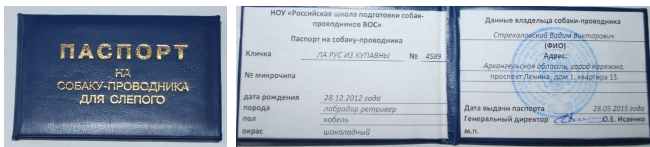
Рисунок 2. Образец паспорта собаки-проводника для незрячего инвалида.

Следует проверить наличие у инвалида с собакой паспорта собаки-проводника для незрячего (документ, подтверждающий ее специальное обучение). Образец действующего паспорта (рис.2):